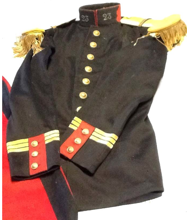
Uniforme du Capitaine de Buttet